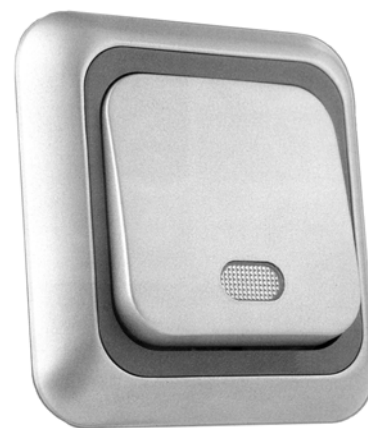
Рис.1 Внешний вид коридорного выключателя КВ1