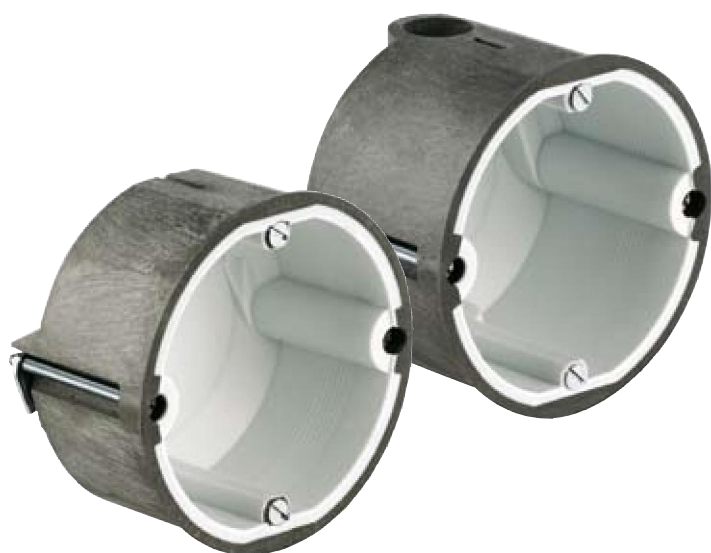
Монтажная коробка HWD 90

При пожаре огнезащитное вспучивающееся покрытие реагирует в кратчайшее время. Материал вспенивается и надежно закрывает монтажное отверстие в огнеупорной стене. Даже при сквозной инсталляции стена соответствует классу F90 без дорогостоящих перекомпоновок и несмотря на электромонтаж.