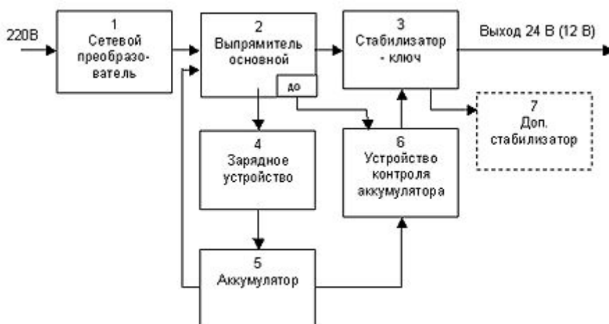
Рис. 4.1. Обобщенная блок-схема источников бесперебойного питания серии «СКАТ».

В настоящее время производственное объединение «Бастин» выпускает около двадцати модификаций источников бесперебойного питания и несколько модификаций источников резервного питания. Ассортимент изделий постоянно обновляется и расширяется, но базовые модели, зарекомендовавшие себя многолетней работой на ответственных объектах, в основном, остаются неизменными. Источники «СКАТ» сертифицированы в Центре стандартизации аппаратуры ОПС МВД РФ (г. Балашиха). Сертификат № РОСС RU.OC03.V00351. В 1999 г. также получен сертификат пожарной безопасности ВНИИПО МВД РФ № ССПБ.RU.УП001. V00858. На все источники питания серии «СКАТ» установлен гарантийный срок эксплуатации 5 лет. Рассмотрим основные группы ИВЭПР серии «СКАТ». Начнем с источников бесперебойного питания, которые, как уже отмечалось выше, одновременно могут являться как основными, так и резервными источниками питания какого-либо объекта или устройства. Все источники бесперебойного питания «СКАТ» построены по одному типу и отличаются друг от друга величинами выходных напряжений и токов и сервисными возможностями. На рис. 4.1. приведена обобщенная блок-схема источников бесперебойного питания серии «СКАТ».