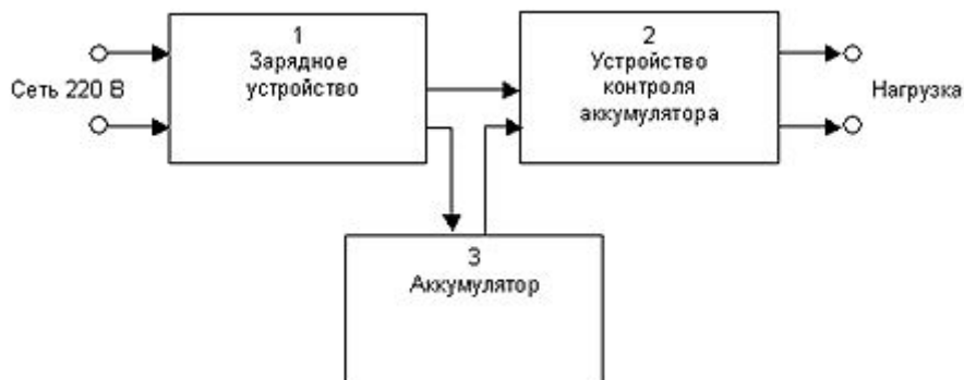
Рис. 4.2. Блок-схема источников резервного питания "СКАТ" группы P/5.

Источники группы P/5 представляют собой устройства для автоматической зарядки аккумулятора при наличии сети, а также подключения нагрузки к аккумулятору и защиты аккумулятора от глубокого разряда при отсутствии сети. При включении в сеть зарядное устройство начинает заряжать аккумулятор фиксированным током 0.5 А. Одновременно устройство контроля аккумулятора подключает к нему нагрузку. Таким образом, напряжение на нагрузке всегда (если оно не отключено устройством контроля разряда аккумулятора) равно напряжению на аккумуляторной батарее. В отсутствие нагрузки (естественно, при наличии основной сети) АКБ заряжается током 0,5 А. При наличии нагрузки ток заряда АКБ представляет собой разность тока зарядного устройства и тока нагрузки, поэтому, при постоянном токе нагрузки, превышающем 0,5 А, АКБ будет разряжаться даже при наличии питающей сети, причем функция контроля аккумулятора при этом не работает. Это нужно иметь в виду при выборе режима работы источника, чтобы не допустить глубокого разряда аккумулятора.